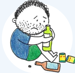
মদের উপর নির্ভরতা