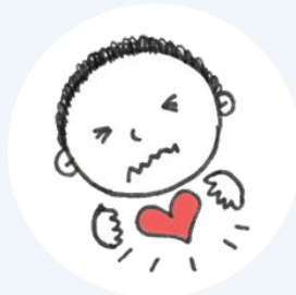
প্রায়ই ভয় পাওয়া এবং / অথবা দ্রুত হৃৎস্পন্দনের সাথে শ্বাসকষ্ট অনুভব করা