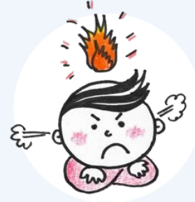
বিরক্তি বা রাগ