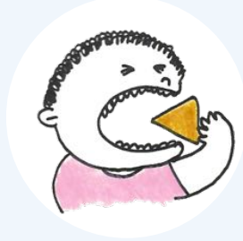
ওজন কমে যাওয়া বা বেড়ে যাওয়া