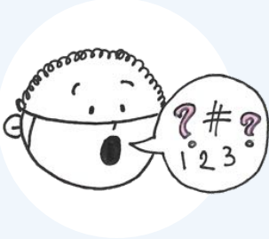
আচরণে পরিবর্তন (যেমন, অস্বাভাবিক কথা বলা)