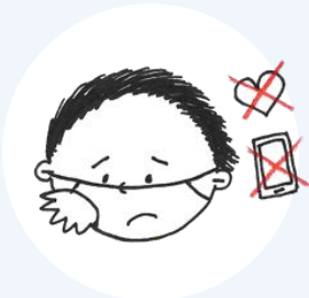
আগ্রহ হারানোর লক্ষণ