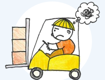
দৈনন্দিন কাজ সম্পাদন কঠিন মনে হওয়া