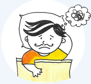
অনিদ্রা বা অতিমাত্রায় ঘুম

আপনি বুঝতে না পারলেও, মানসিক চাপ আমাদের অনুভূতি, চিন্তাধারা এবং কাজকর্মের উপর বিকল্প প্রভাব ফেলতে পারে। তাই, ভাল হয়ে ওঠার জন্য নিম্নলিখিত লক্ষণগুলির ব্যাপারে সতর্ক হওয়া এবং সহায়তা চাওয়া অত্যন্ত গুরুত্বপূর্ণ।