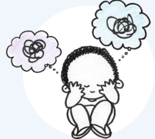
স্থায়ী চিন্তাধারাকে নিয়ন্ত্রণ করতে অক্ষম হওয়া